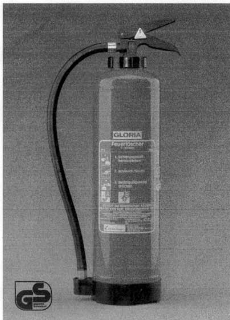
Abb. SE 6 I